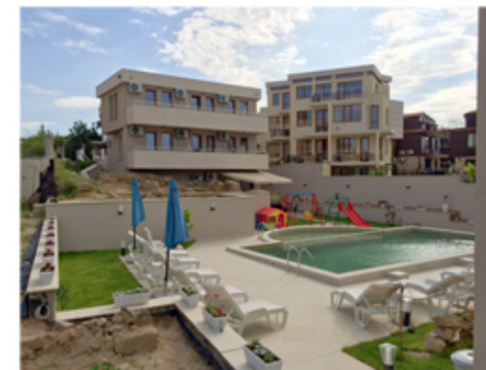
Хотел "Мелиа Мар"