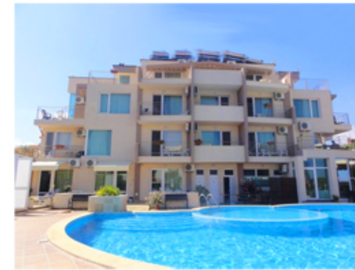
Хотел "Селена Бийч"