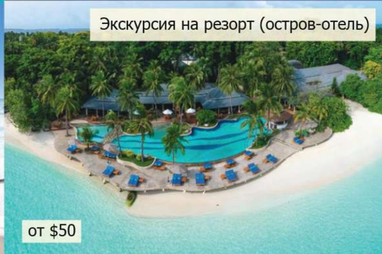
Экскурсия на резорт (остров-отель)