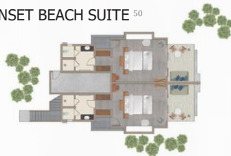
SUNSET BEACH SUITE 50

58 м² — 1 спальня / Возможно объединение номеров, соединенных межкомнатной дверью.