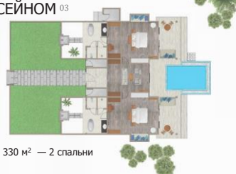
SUNSET BEACH VILLA C 2 СПАЛЬНЯМИ И БАСЕЙНОМ 03