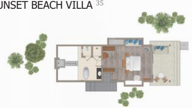
SUNSET BEACH VILLA 35

58 м² — 1 спальня / Возможно объединение номеров, соединенных межкомнатной дверью.