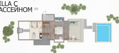
SUNSET BEACH VILLA C БАСЕЙНОМ 09