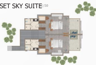
SUNSET SKY SUITE 50

58 м² — 1 спальня / Возможно объединение номеров, соединенных межкомнатной дверью.