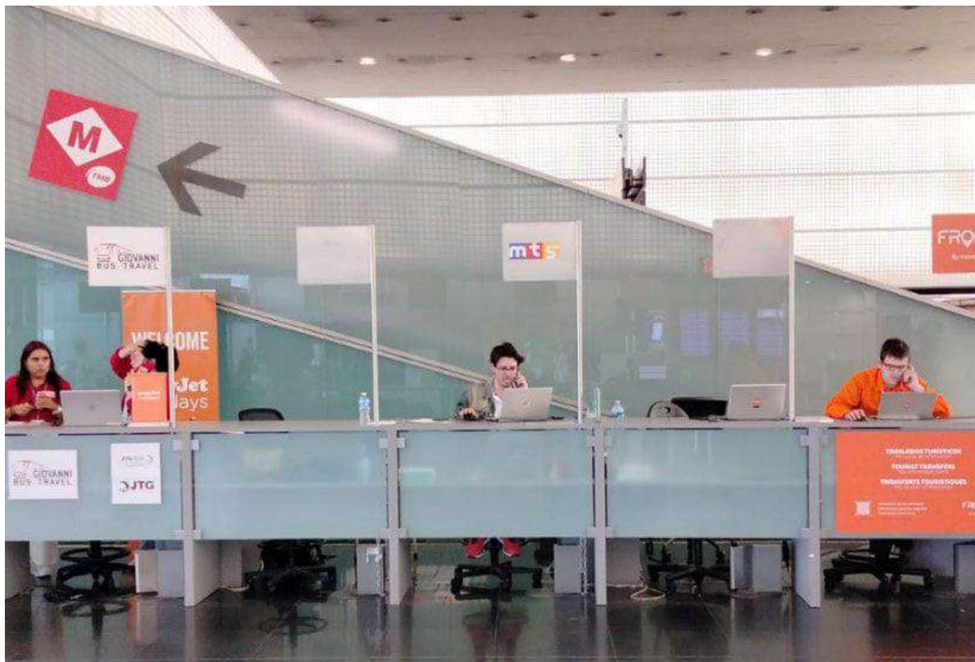
Фото місця зустрічі

ЗВЕРНІТЬ УВАГУ! Якщо ви не використаєте заброньований трансфер, витрати на нього, а також витрати на самостійний трансфер не компенсуються.