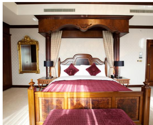
Президентские апартаменты Султан

Президентские апартаменты PASHA – это великолепный номер площадью 206 кв.м., расположенный на верхнем этаже отеля с прекрасным панорамным видом на город и горы.