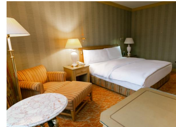
Классик для людей с ограниченными возможностями

Президентские апартаменты SULTAN площадью 206 кв.м. находятся на 11-м этаже отеля, откуда открывается прекрасный панорамный вид на город и горы. Апартаменты состоят из просторной спальни комнаты, столовой и гостиной с широким письменным столом, а также полностью оснащенной кухни и шикарной ванной с джакузи и эксклюзивными туалетными принадлежностями.