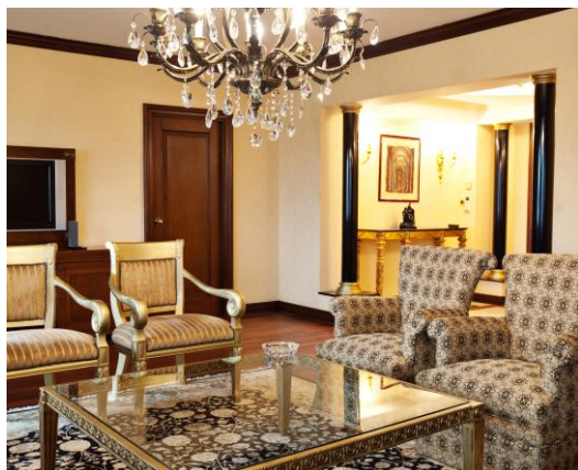
Президентские апартаменты Паша

Президентские апартаменты PASHA – это великолепный номер площадью 206 кв.м., расположенный на верхнем этаже отеля с прекрасным панорамным видом на город и горы.