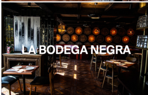
LA BODEGA NEGRA