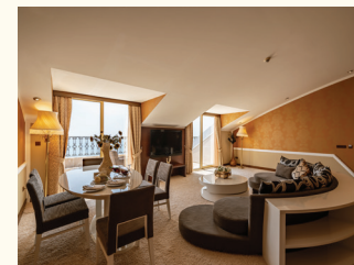
3 НОМЕР | КОРОЛЕВСКИЙ ЛЮКС