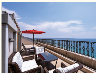
9 НОМЕР | ЛЮКС С ТЕРРАСОЙ