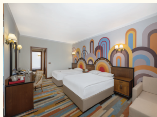
16 НОМЕР | СЕМЕЙНЫЙ НОМЕР