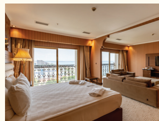
2 НОМЕР | ПОЛУЛЮКС